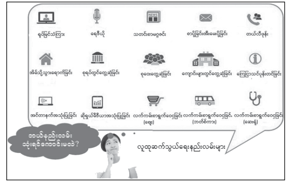
ပုံ(၂) လူထုဆက်သွယ်ရေးနည်းလမ်းများ

လူထုဆက်သွယ်ရေးနည်းလမ်းများကို ပုံ(၂)တွင် ဖော်ပြထားပါသည်။ အချို့နည်းလမ်းများမှာ ကုန်ကျစရိတ်သက်သာပြီး လူအများစုကို လွှမ်းမိုးနိုင်သော နည်းလမ်းများဖြစ်ပြီး ဥပမာအားဖြင့် ရေဒီယို၊ ရုပ်မြင်သံကြားတို့ဖြစ်ပါသည်။ သို့ရာတွင် အသိပညာ၊ သတင်းအချက်အလက် ပေးသူဘက်မှ တစ်ဘက်သက်ပေးပြီး တိုက်ရိုက် အမေးအဖြေပြုလုပ်ရန်ကိုမူ အခြားဆက်သွယ်ရေးနည်းလမ်းတစ်ခု (ဥပမာ-telephone hot line)ထပ်မံအသုံးပြုမှုသာဆောင်ရွက်နိုင်မည်ဖြစ်ပါသည်။ အကယ်၍ အီးလ်မေးအသုံးပြုပါက အီးလ်မေး လိပ်စာရှိသူများကိုသာ ဆက်သွယ်နိုင်ပြီး အီးလ်မေးအသုံးမပြုသည့် အခြားလူထုများမှာ အကျိုးကျေးဇူးမရရှိနိုင်ပါ။ ထို့ကြောင့် နည်းလမ်းရွေးချယ်ရာတွင် အသုံးပြုမည့် ငွေကြေးအင်အား၊ ရည်ရွယ်သည့် လူပရိသတ်အရေအတွက်ကို လွှမ်းမိုးနိုင်မှု၊ လူထုမှရရှိလက်လှမ်း မီနိုင်သည့်ဆက်သွယ်ရေး နည်းလမ်းဖြစ်ရေးစသည့် အချက်များအပေါ် မူတည်၍ ရွေးချယ်အသုံးပြုသင့်ပါသည်။