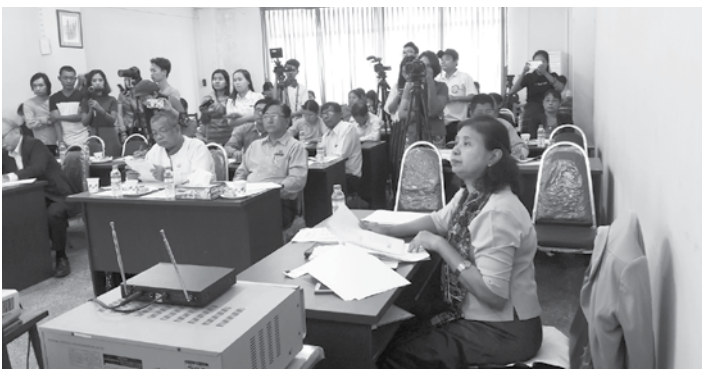
မျိုးချုပ်က ပြန်လည်ရှင်းလင်း ပြောကြားခဲ့ပါသည်။ အဆိုပါစာတမ်းဖတ်ပွဲသို့ မြန်မာ ကုန်သွယ်မှုနှင့်တင်ပို့ရေးအဖွဲ့ ညွှန်ကြားရေးမှူးချုပ်နဲ့ အရာထမ်း၊ အမှုထမ်းများ၊ ကုန်သွယ်ရေးဦးစီးဌာန၊ စားသုံးသူရေးရာဦးစီးဌာနတို့မှ အရာထမ်း၊ အမှုထမ်းများ၊ JICA Project Team မှ တာဝန်ရှိသူများ တိုင်းငါးလုပ်ငန်းဦးစီး

ဂျပန်အပါအဝင် ဥရောပနဲ့ တရုတ်နိုင်ငံတို့ကလည်း ဝယ်လိုအားကောင်းနေကြောင်း ပုစွန်တင်ပို့မှု Top 10 နိုင်ငံစာရင်းထဲတွင် အမေရိကန်၊ ဩစတြေးလျနဲ့ တရုတ် (တိုင်ပေ)တို့ ထပ်တိုးလာကြောင်း၊ ဂျပန်နိုင်ငံကလည်း ရေထွက်ကုန် အများဆုံးတင်သွင်းတဲ့ နိုင်ငံဖြစ်တဲ့အတွက် ရေရှည်ဆက်လက်တင်ပို့သင့်တဲ့ဈေးကွက်ဖြစ်ကြောင်း၊ ဒါကြောင့် ပုစွန်သားပေါက်ကန်၊ မွေးကန်များပြန်လည် ဖော်ဆောင်ရန်နဲ့ မျိုးကောင်း မျိုးသန့်ရရှိရေး၊ Value Added တင်ပို့နိုင်ရေး၊ ငွေပေးချေမှု၊ ငွေလွှဲမှုများအတွက် ဘဏ်ပိုင်းဆိုင်ရာ လွယ်ကူစေရေးတို့ကို သုံးသပ်တင်ပြခဲ့ပြီး "Made in Myanmar" တံဆိပ်တပ်ဆင်နိုင်ရေးအတွက် ဆောင်ရွက်ရန် ကိစ္စများကို ဆွေးနွေးအကြံပြုခဲ့ပါသည်။ ထို့သို့ ဆွေးနွေးမေးမြန်း အကြံပြုချက်များအပေါ် ညွှန်ကြားရေး