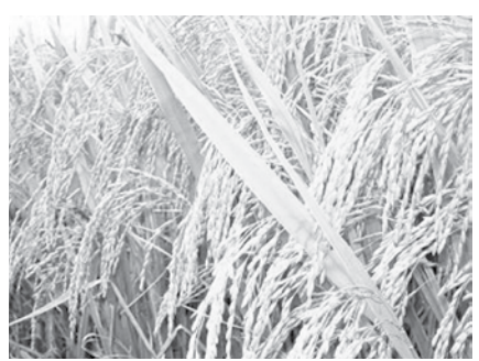
မှန်မှ၊ ပင်သန်မည်” ဆိုသကဲ့သို့ မျိုးကောင်းမျိုးသန် ရရှိရေးသည် လွန်စွာအရေးကြီးလှပါတယ်။

ထို့ကြောင့် မြန်မာနိုင်ငံအနေဖြင့် ပို့ကုန်ကဏ္ဍတိုးတက်မြှင့်တင်ရေးအတွက် အဓိကမဏ္ဍိုင်မှရမည်လျက်ရှိသော ဆန်စပါး အပါအဝင် လယ်ယာထွက်ကုန်ပစ္စည်းများကို စိုက်ပျိုးထုတ်လုပ်တင်ပို့ရာ၌ “မျိုးစေ့မှန်၊ ပင်မသန်၊ မျိုးစေ့